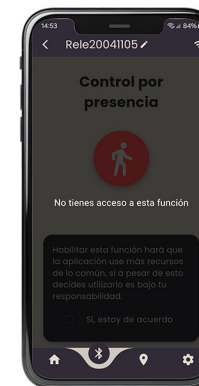
Control por presencia