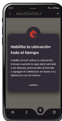
Habilitar la función "Todo el tiempo"